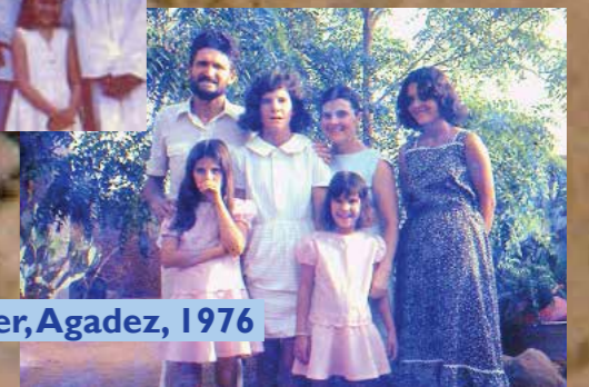
famille Moser, Agadez, 1976