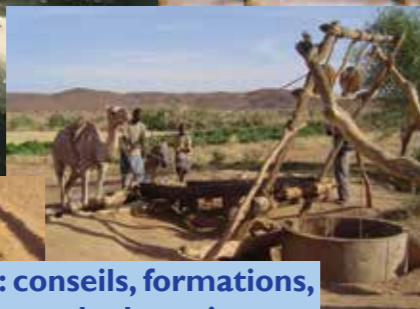
jardins : conseils, formations, commande de graines